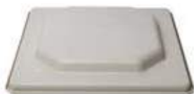
Coperchio copri ceste

Codice: 100100 Giallo: cesta 4x4 Blu: cesta 5x5 Verde: cesta 6x6 Rosso: cesta 7x7