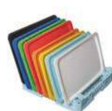
Cesta per 8 vassoi Gastronorm/Euronorm