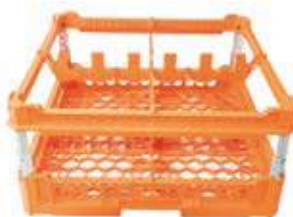
KIT 3 2x2

Misura cesta: 500x500 mm Altezza bicchiere: Da 120 a 240 mm Misura scomparti: 226x226 mm