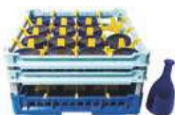
Cesta per 16 bottiglie da 75 cl.