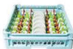
Cesta per 28 tazzine e piattini da caffè