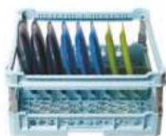
Cesta per 8 piatti grandi con rialzo regolabile