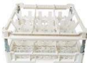
KIT 3 3x3

Misura cesta: 500x500 mm Altezza bicchiere: Da 120 a 240 mm Misura scomparti: 146x146 mm