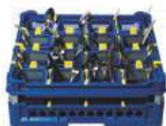
Cesta con 16 contenitori portaposate