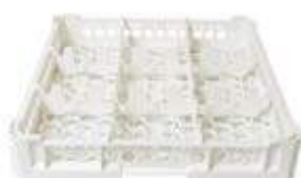
KIT 1 3x3

Misura cesta: 500x500 mm Altezza bicchiere: Da 0 a 65 mm Misura scomparti: 146x146 mm