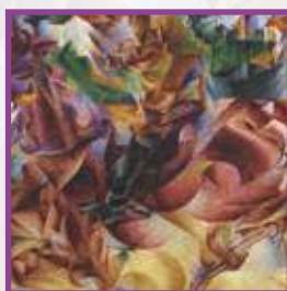
[1912, Elasticità , Umberto Boccioni ]