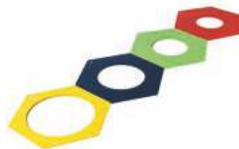
Misuratore manuale del diametro dei bicchieri

Codice: 100100 Giallo: cesta 4x4 Blu: cesta 5x5 Verde: cesta 6x6 Rosso: cesta 7x7