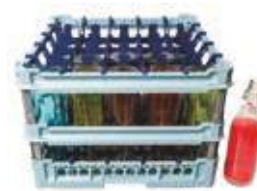
Cesta per 25 bottiglie da 100 cl. con convogliatori