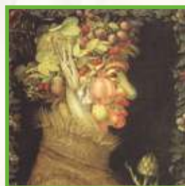
[1573, L'Estate , Giuseppe Arcimboldo ]