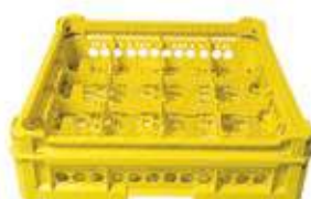
KIT 2 4x4

Misura cesta: 500x500 mm Altezza bicchiere: Da 65 a 120 mm Misura scomparti: 113x113 mm