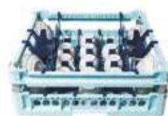
Cesta per 17 tazze e piattini da thè