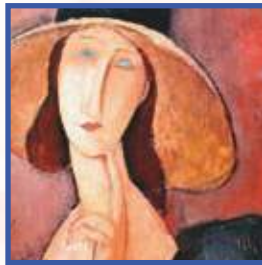
[1918, Jeanne Hébuterne con cappello , Amedeo Modigliani ]