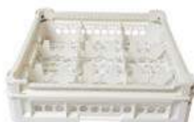
KIT 2 3x3

Misura cesta: 500x500 mm Altezza bicchiere: Da 65 a 120 mm Misura scomparti: 146x146 mm