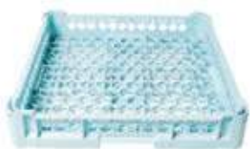
Cesta maglia larga