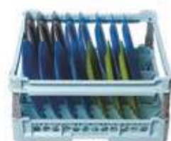
Cesta per 15 piatti medi piani e fondi con rialzo regolabile