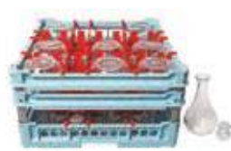
Cesta per 9 bottiglie da 127 cl.