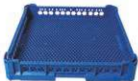
Cesta maglia stretta