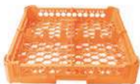
KIT 1 2x2

Misura cesta: 500x500 mm Altezza bicchiere: Da 0 a 65 mm Misura scomparti: 226x226 mm