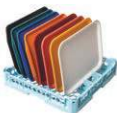
Cesta per 8 vassoi fast-food