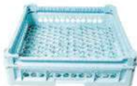
Cesta maglia larga con rialzo