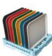
Cesta per 8 vassoi mensa