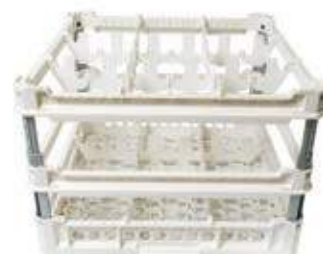
KIT 4 3x3

Misura cesta: 500x500 mm Altezza bicchiere: Da 240 a 340 mm Misura scomparti: 146x146 mm