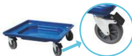
Carrello con vasca raccogli gocce e freno

Codice: CA500 Misura: 550x550 mm Peso unitario: 2,60 Kg. Capacità di carico: 140 kg