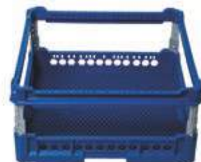
Cesta maglia stretta con rialzo regolabile