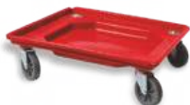
Carrello con vasca raccogli gocce

Codice: CA500 Misura: 550x550 mm Peso unitario: 2,60 Kg. Capacità di carico: 140 kg