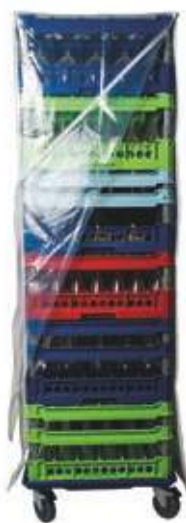
Cappottina copri ceste