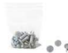
Perni per regolare l'altezza delle ceste