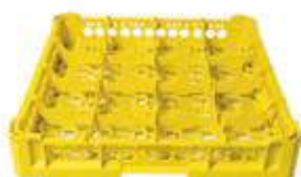
KIT 1 4x4

Misura cesta: 500x500 mm Altezza bicchiere: Da 0 a 65 mm Misura scomparti: 113x113 mm