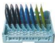
Cesta per 8 piatti grandi