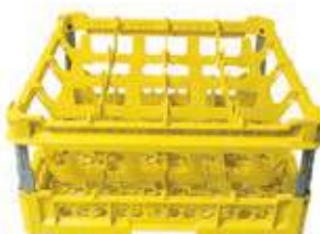
KIT 3 4x4

Misura cesta: 500x500 mm Altezza bicchiere: Da 120 a 240 mm Misura scomparti: 113x113 mm