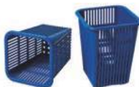
Cestino porta posate