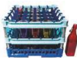
Cesta per 25 bottiglie da 100 cl.