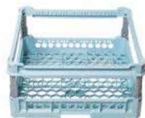
Cesta maglia larga con rialzo regolabile