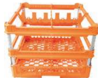
KIT 4 2x2

Misura cesta: 500x500 mm Altezza bicchiere: Da 240 a 340 mm Misura scomparti: 226x226 mm