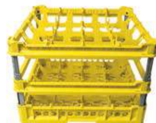
KIT 4 4x4

Misura cesta: 500x500 mm Altezza bicchiere: Da 240 a 340 mm Misura scomparti: 113x113 mm