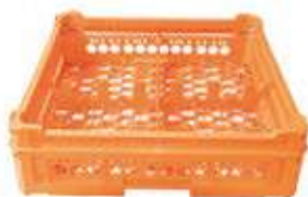
KIT 2 2x2

Misura cesta: 500x500 mm Altezza bicchiere: Da 65 a 120 mm Misura scomparti: 226x226 mm