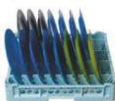
Cesta per 15 piatti medi piani e fondi