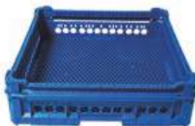
Cesta maglia stretta con rialzo